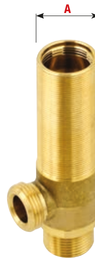
Art. 1700 A Ø 32x19"

1 UNI 5705-65 CW 617 N Raccordo G.3/4" Connection G. 3/4" Fitting mit 3/4"-Drehung