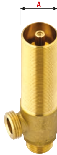
Art. 900 A Ø 28x19"